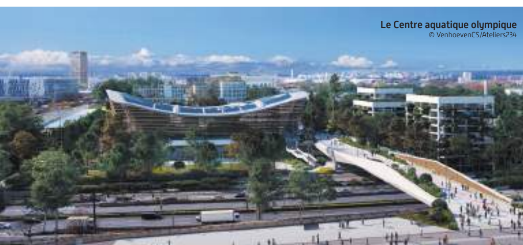
Le Centre aquatique olympique © VenhoevenCS/Ateliers234

Plaine Commune et la Seine-Saint-Denis sont au cœur des Jeux de 2024. En accueillant des sites olympiques et paralympiques et des sites d'entraînement, le territoire bénéficiera d'une forte visibilité et d'un précieux héritage pour les villes et leurs habitants. Le projet olympique et paralympique a cependant évolué. Tour d'horizon.